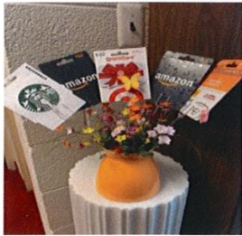
Basket 3 – Gift Cards Value $180