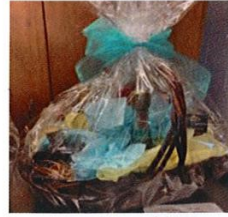
Basket 2 – Liquor Value $ 185