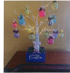
Basket 5 – Money Tree - Value $150 ($130 in Cash)