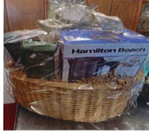
Basket 4 – Coffee & Liqueur Value $175