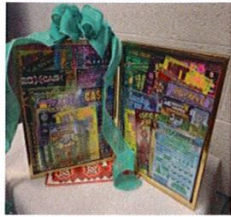
Basket 1- Lotto Frame Value $125