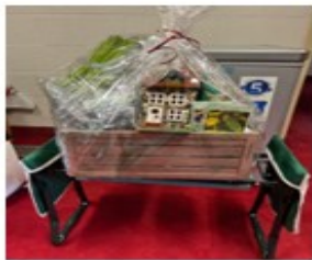
Green Thumb Basket Value/Вартість $190