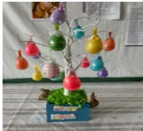
Money Tree Value/Вартість $210