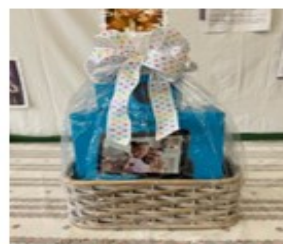
Echo Show & Dot Basket Value/Вартість $300