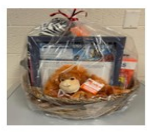
Zoo Basket Value/Вартість $190