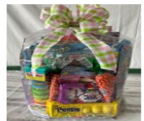
Kid's Basket Value/Вартість $85

Tickets are $5 each or 5 for $20 1 Квиток - $5 або 5 квитків - $20