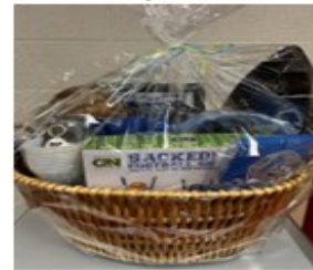
Detroit Lions Basket Value/Вартість $250