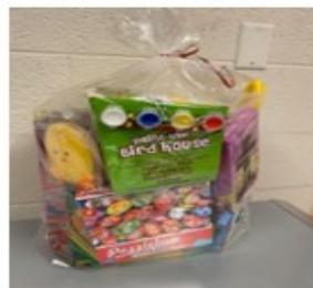
Girl's Basket Value/Вартість $75