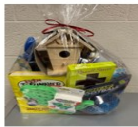
Boy's Basket Value/Вартість $95